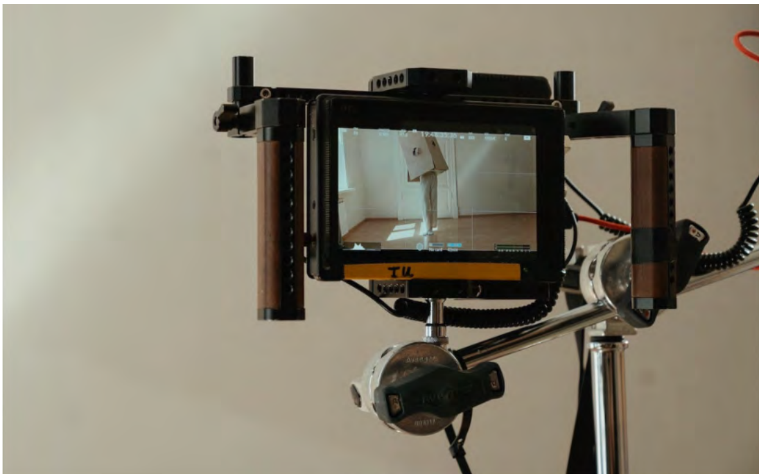
Tolle Sommerferienkurse 2023

Gearbeitet wird in der Natur, am Tablet, Smartphone, Laptop, mit künstlerischem Material und mit der Kamera.