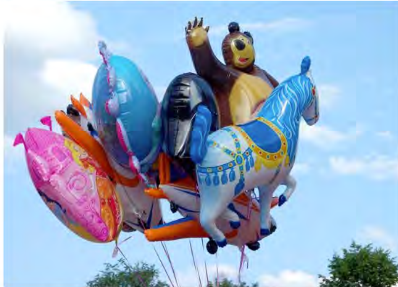
Am Sonntag lockt ein großes Spielefest in den Hirschgarten. Von 14 bis 18 Uhr wird gespielt und gefeiert.

München · „Spielen schafft Freundschaft“ heißt das Motto der diesjährigen Spielsaison der Spiellandschaft Stadt. Am Sonntag, 14. Mai, sind große und kleine Mitspieler von 14 bis 18 Uhr eingeladen, die vielen Stationen des Eröffnungsfestes auf dem Gelände des Münchner Hirschgartens, Eingang De-la-Paz-Straße beim Wasserspielplatz auszuprobieren, mitzumachen und sich zu informieren.