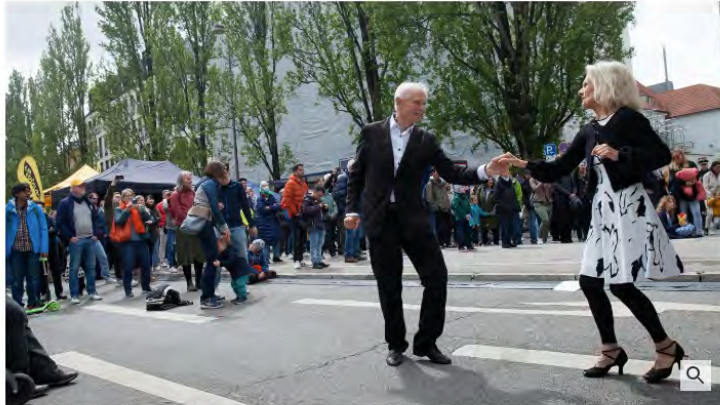
Ein Paar tanzt zur Musik der Bigband O-Tunes vor der Charivari-Bühne.

14. Mai 2023, 15:19 Uhr | Lesezeit: 1 min