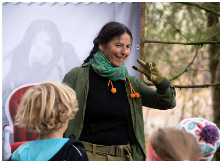
Tipps für das Pfingstwochenende 2023: City Stories Geschichtenfest.

Vier Tage lang werden Geschichten wertvollen Schätzen erfunden und gelebt. Die Teilnehmer:innen erweitern so ihren persönlichen WERTSCHATZ! Beim Geschichtenfestival im Luipoldpark finden und erfinden die Teilnehmenden Geschichten über wertvolle Schätze ihrer Umwelt.